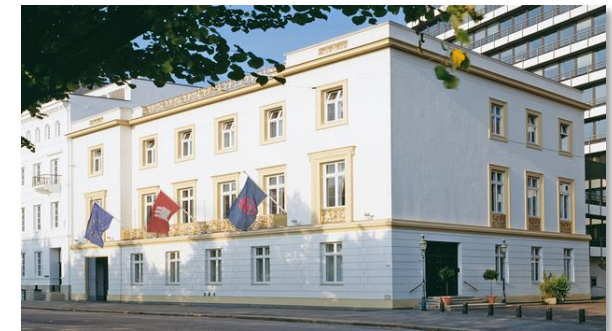
Der Übersee – Club e.V. Hamburg